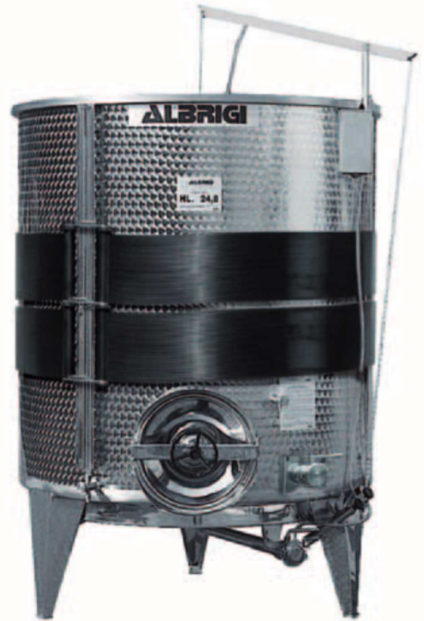
I Semprepieno medi da lt 2480 con intercapedine Polifascia