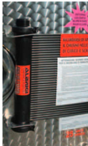
I La Polifascia può essere spedita arrotolata, ed essere costruita fino a 12 mt. di lunghezza